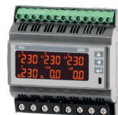
Měřič parametrů 3f sítě na DIN lištu - N43.