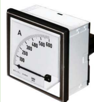
Analogové přístroje řady EA, MA s krytím IP65 z čelní strany.