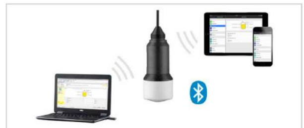
Bezdrátové připojení prostřednictvím standardních zařízení