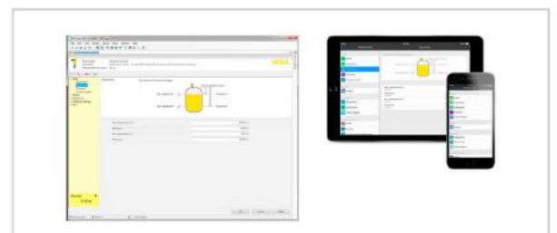
Nastavení prostřednictvím PACTware nebo aplikace VEGA Tools