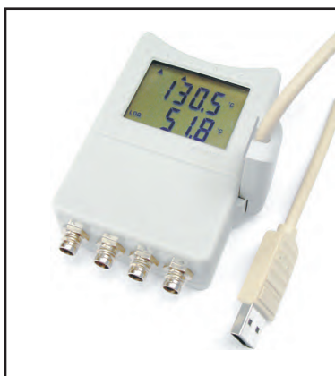
Teploměr S0141 (S0541, S0841, S0842) s USB adaptérem